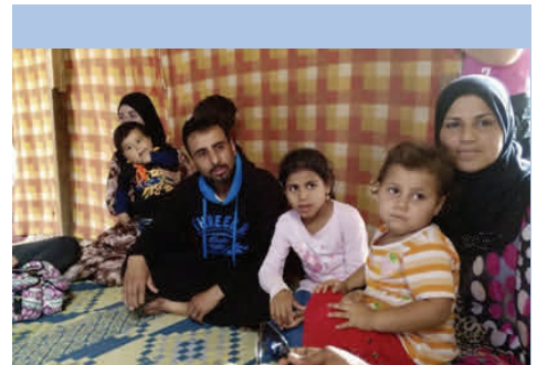
família de refugiats sirians a Beirut, en espera d'un destí segur

Els ajuntaments hauran de presentar una memòria on s'inclogui la descripció detallada dels projectes que vulguin subvencionar i informació econòmica dels seus costos.