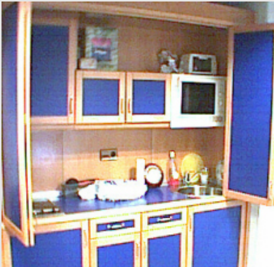
Coffee-corner de Gavà