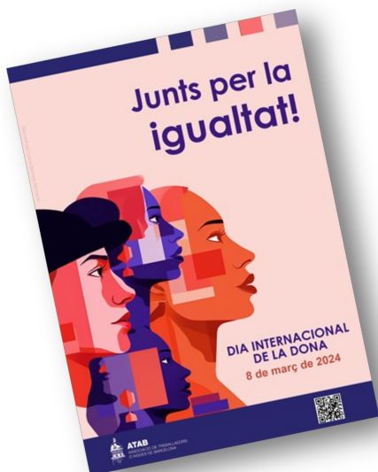
Cartell commemoratiu ATAB— Dia de la Dona 2024