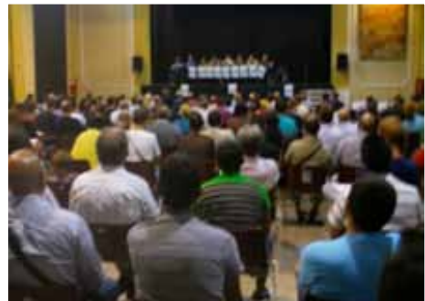
Vista general de l'Assemblea General.

No estem d'acord amb la Direcció de RRHH quan afirma que l'aplicació de l'article 44 és garantista. Garantista seria que no es pretengués que els nostres companys renunciïn al nostre conveni col·lectiu.